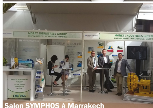
Salon SYMPHOS à Marrakech