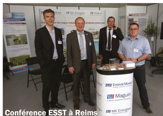
Conférence ESST à Reims